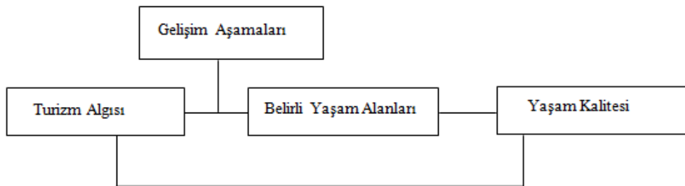
Şekil 1: Turizmin Etkileri Arasındaki İlişkiler, Gelişim Aşamaları, Belirli Yaşam Alanları ve Yaşam Kalitesi