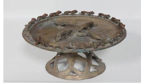
Demir ve işlemeli eşyalar (MÖ 8. yüzyıl)