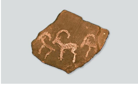
Boynuzlu keçi figürleri (MÖ 3.000)

Özbekistan Devlet Tarihi Müzesi, 1876 yılında kurulan Orta Asya'daki en büyük eğitim ve tarih kurumlarından biridir. Çok disiplinli bir araştırma merkezi olarak müze, bir araştırma enstitüsü, maddi ve manevi kültür anıtlarının en büyük toplanma alanı ve tarihsel bilgiyi popülerleştirme gibi görevleri yerine getirmektedir. Müze, 1943'te kurulan Özbekistan Cumhuriyeti Bilimler Akademisi'nin bir parçasıdır. Müze her yıl on binlerce kişi tarafından ziyaret edilmektedir. Ziyaretçiler için turlar yapılmakta, dersler verilmekte, etkinlikler düzenlenmektedir. Müze binası, Özbek mimarisinin geleneksel ve ilerici ilkelerinin, geometrik şekillerin zengin süslemeyle ilişkisinin yansıdığı 20. yüzyılın ikinci yarısında Taşkent'in en iyi mimari eserlerinden biri olarak öne çıkmaktadır. Cephenin güneşten koruyucu metal ızgaraları beyaz-pembe mermer ile kaplanmıştır. Giriş kapıları doğal ahşaptan yapılmış ve geleneksel oymalar ile dekore edilmiştir.