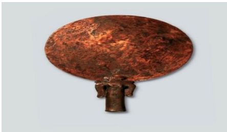
Bronz dökün ayna (MÖ 17.-16. yüzyıl)