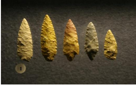
Taş aletler (Paleolitik Dönem-MÖ 10.000)

Bu müze daha çok 19. ve 20. Yüzyıl eserlerine yoğunlaşsa da, İslam öncesi Türk eserlerinin de sergilendiği görülmektedir. Bu müzede yapılan sergi faaliyetleri ile Türk kültürü ve sanatına dair ürünlerin sergilendiği söylenebilir. Taldysu-1, Kurkureuk mezarları, Almatı bölgesindeki Tunç Çağı (MÖ 10. - 9. yüzyıllar) ve Erken Demir Çağı (MÖ 4. MÖ - 4. yüzyıl) ile ilgili yerleşim yerlerindeki anıtları, Akterek ve Sulu Koyan mezarları, Kultobe'de, Kylyshzharand Kultobe'de Arys kültürü ile ilgili kazılar (MÖ 4. yüzyıl - MS 4. yüzyıl), Saka kültürü (MS 4.-1. MS), Sarmat kültürü (MÖ 1. – 3. yüzyıl), Sünnu (Hun) kültürü (MÖ 1. – 3. yüzyıl) ile ilgili arkeolojik kazılar sonu elde edilen sanat eserlerin burada sergilendiği ve turizme açıldığı söylenebilir.