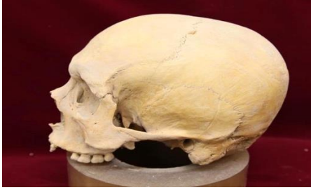
Berel cenazesi kafatası (Erken Demir Çağı)