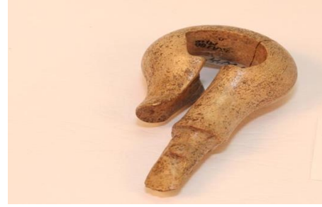
Kemikten yapılmış alet (Bronz Dönem)